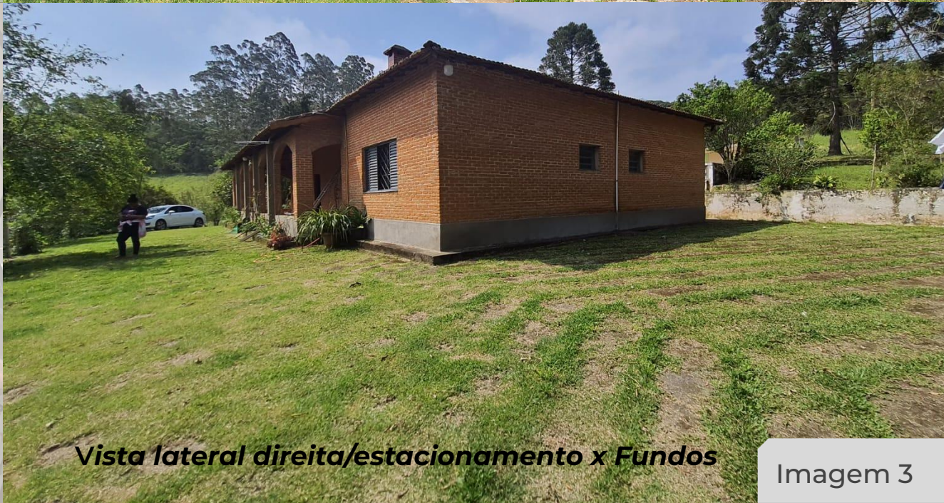
Vista lateral direita/estacionamento x Fundos