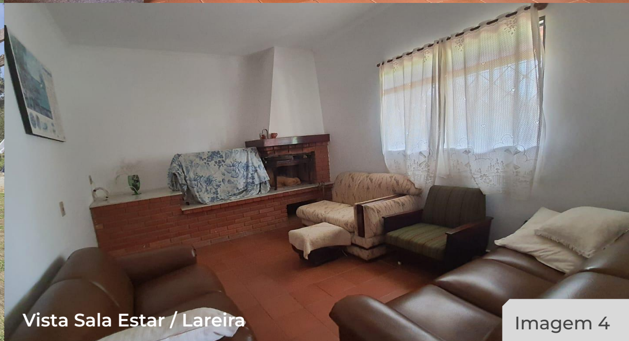
Vista Sala Estar / Lareira