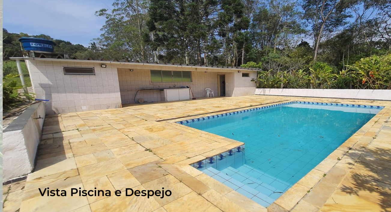
Vista Piscina e Despejo