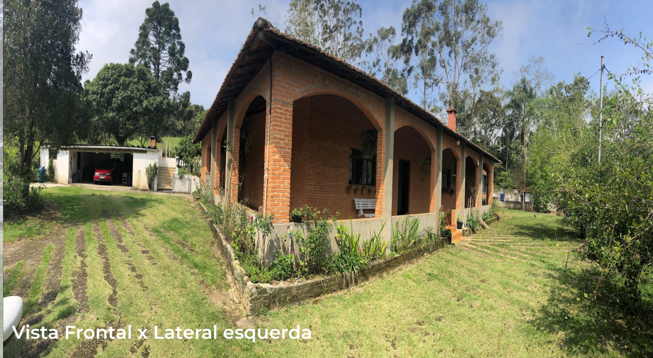
Vista Frontal x Lateral esquerda