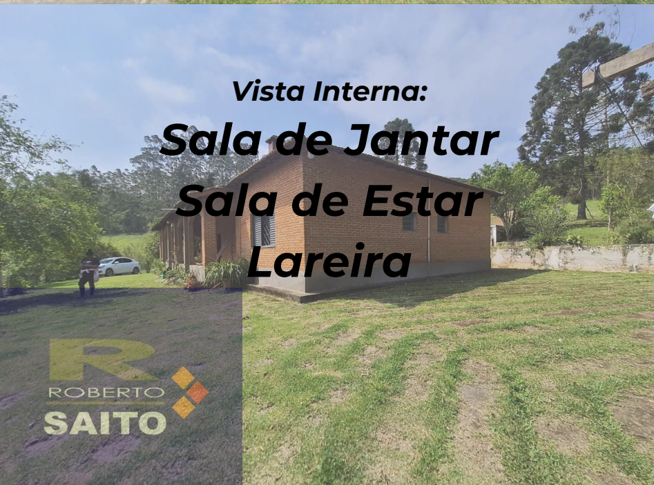
Vista Interna: Sala de Jantar Sala de Estar Lareira