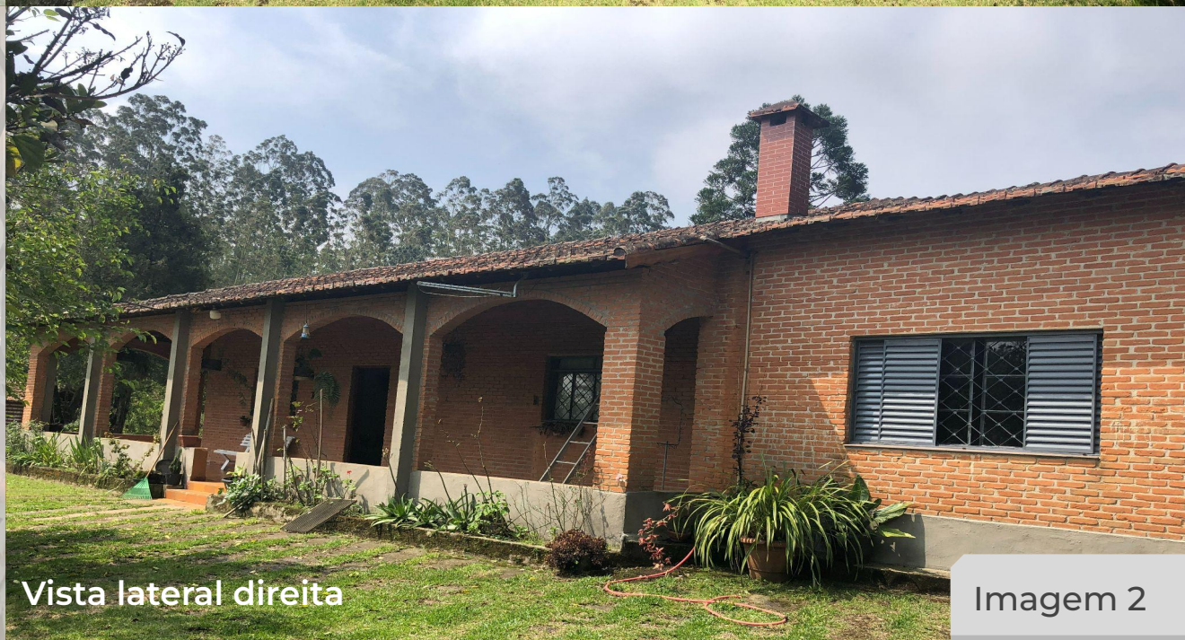
Vista lateral direita