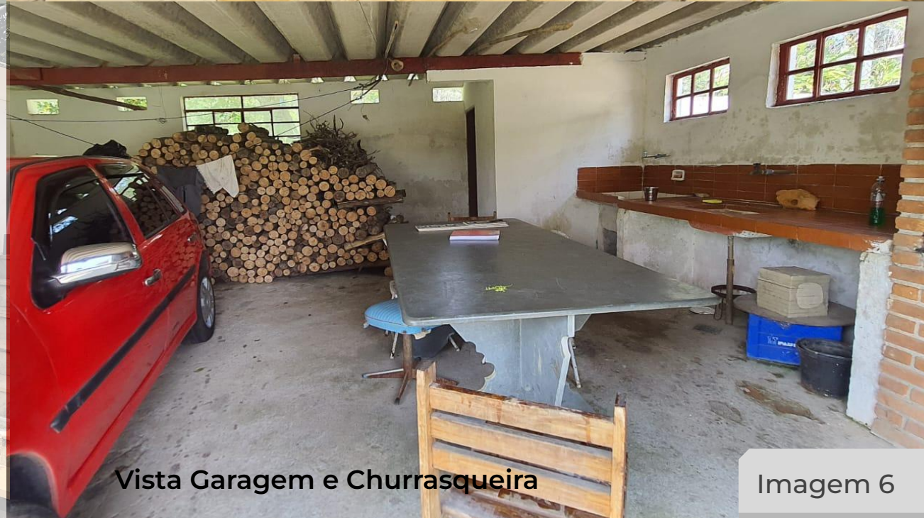
Vista Garagem e Churrasqueira