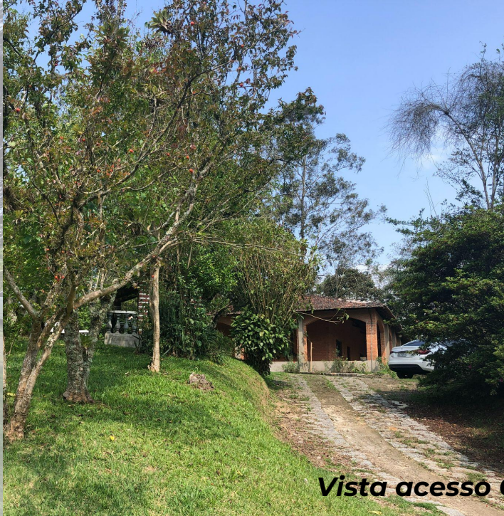
Vista acesso Casa sede