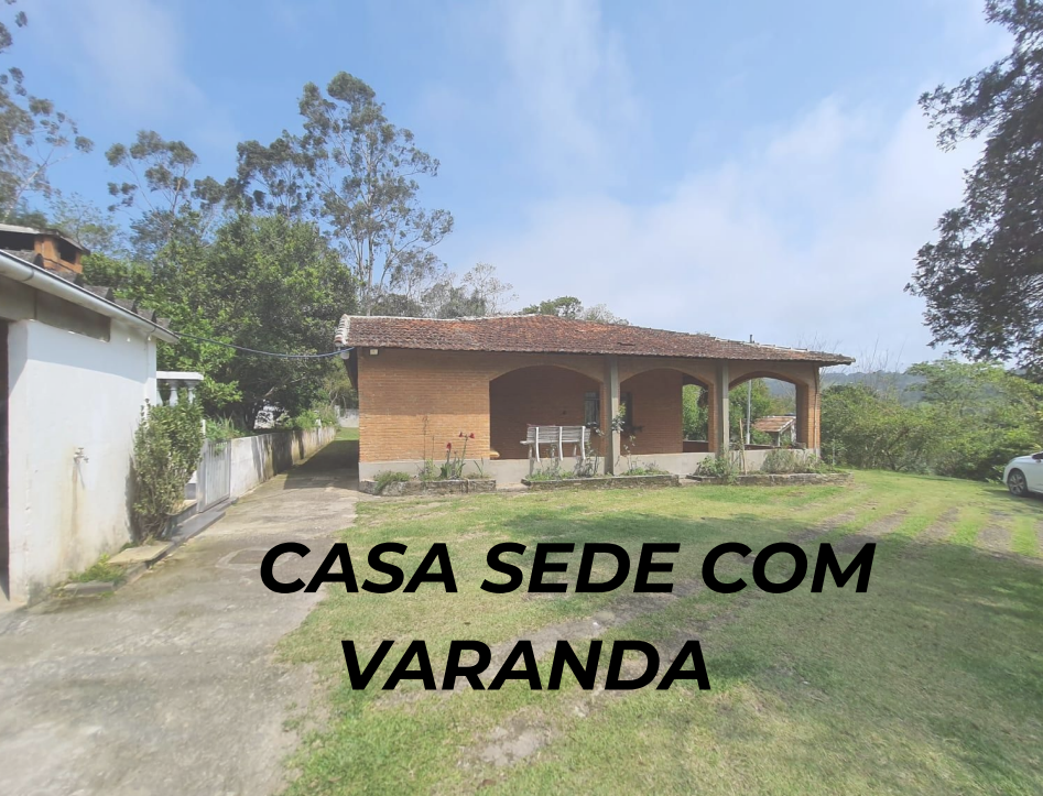
CASA SEDE COM VARANDA