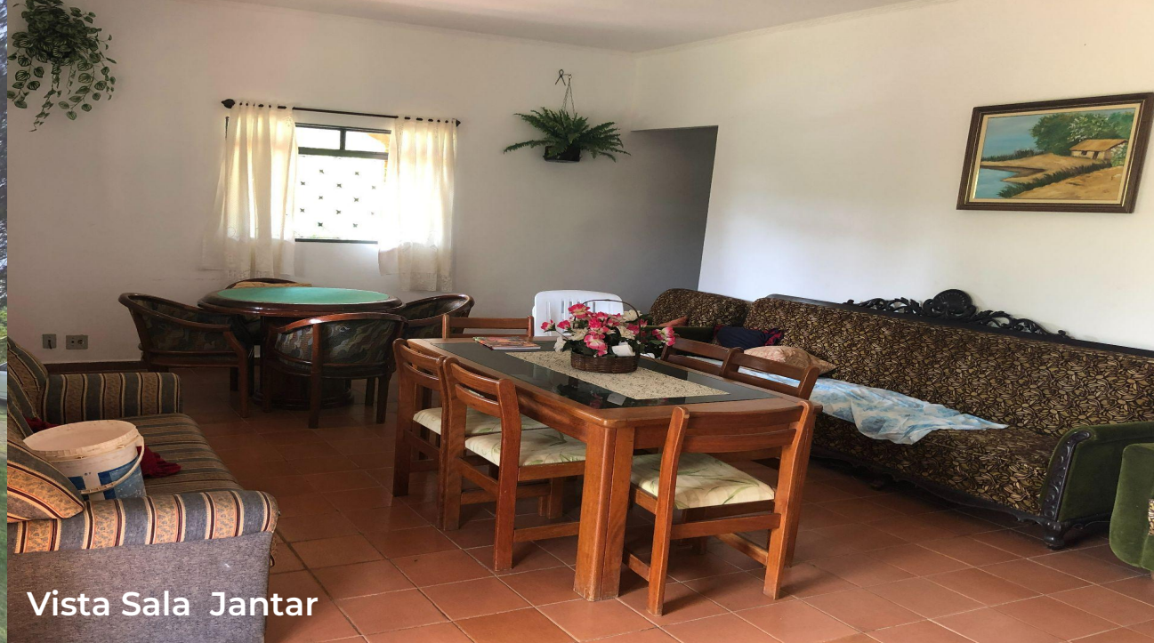
Vista Sala Jantar